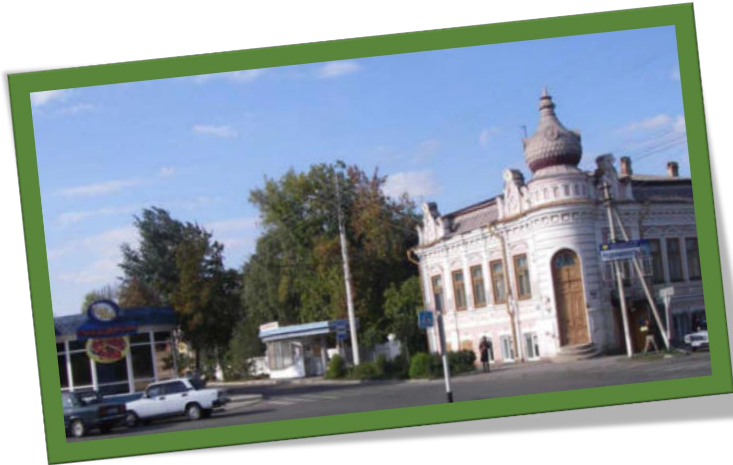
Это дом по улице Р.Люксембург на пересечении с улицей К. Либкнехта